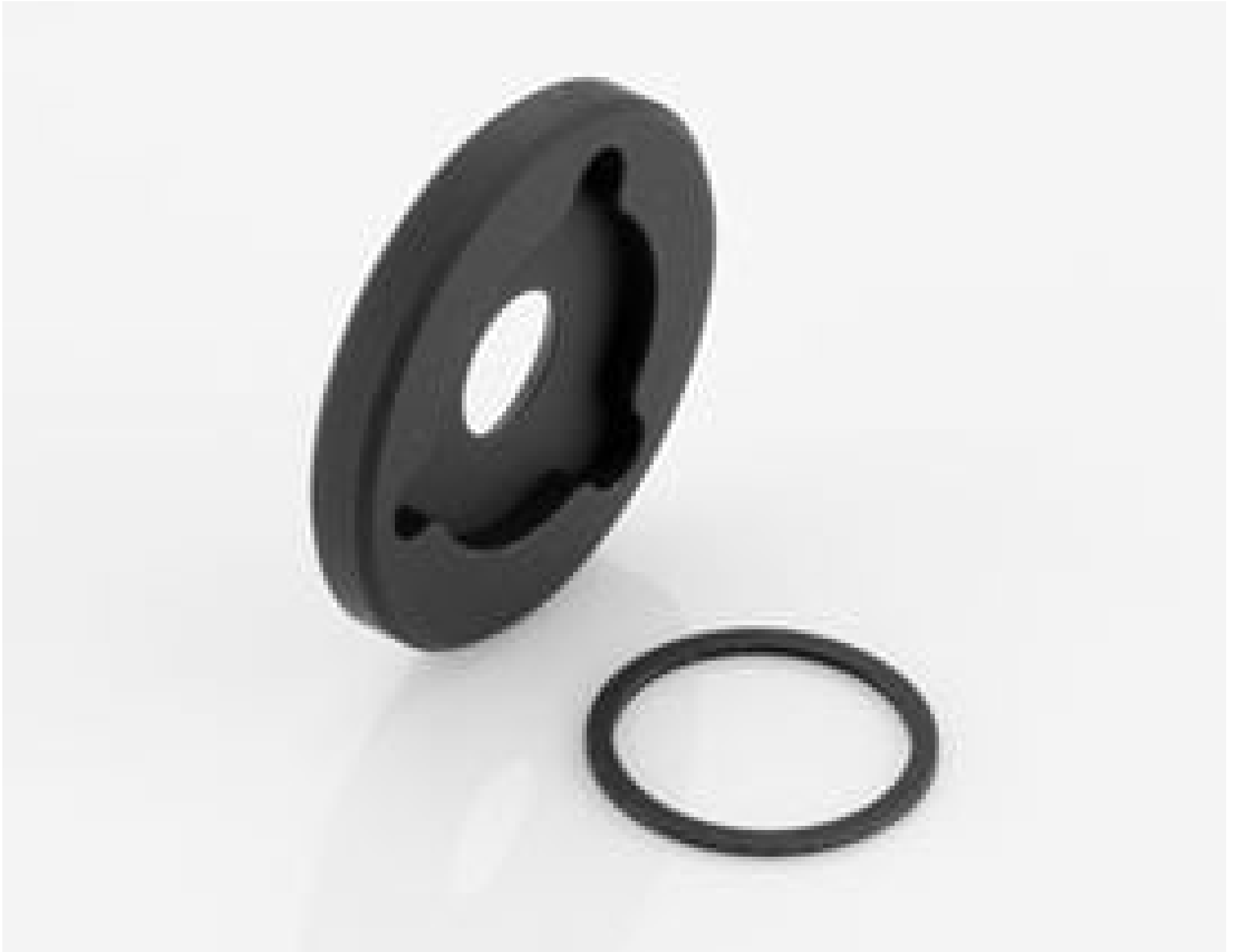
Filter Holder for Cx lens