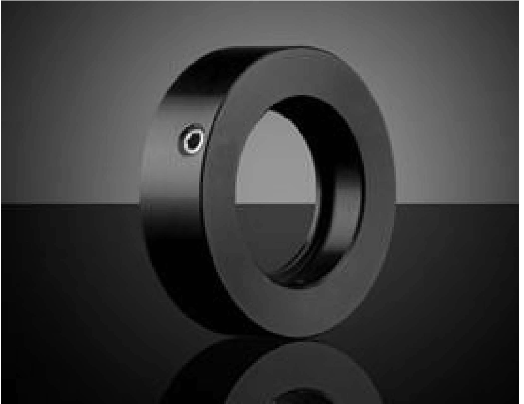
M25.5 x 0.5 Adapter for 18mm Dia. CompactTL® Telecentric Lens, #88-212