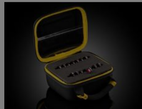
Hart beschichtete Bandpassfiltersets OD 4