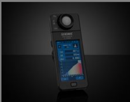
Testen und Messen