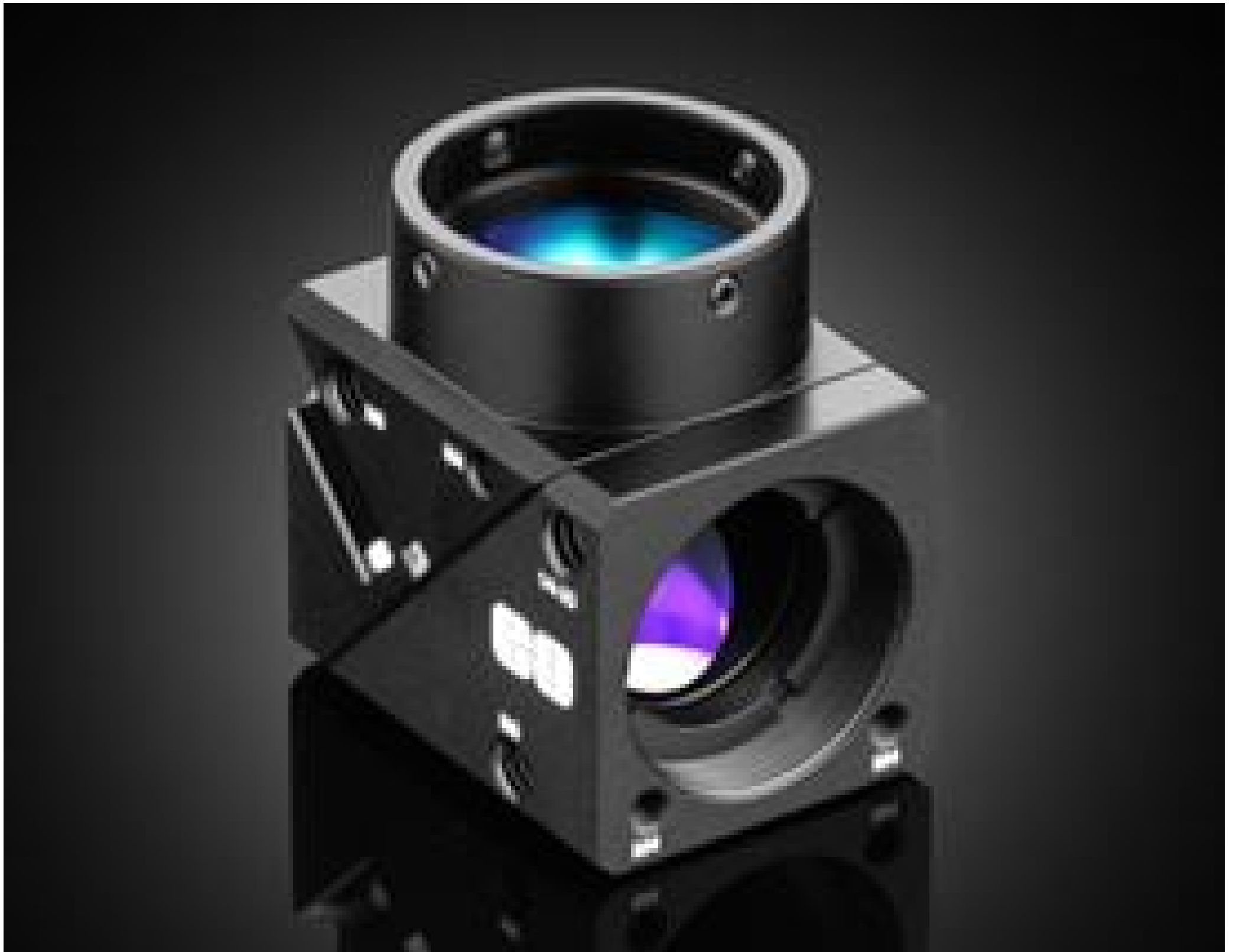
#18-508: Filter Cube Assembly