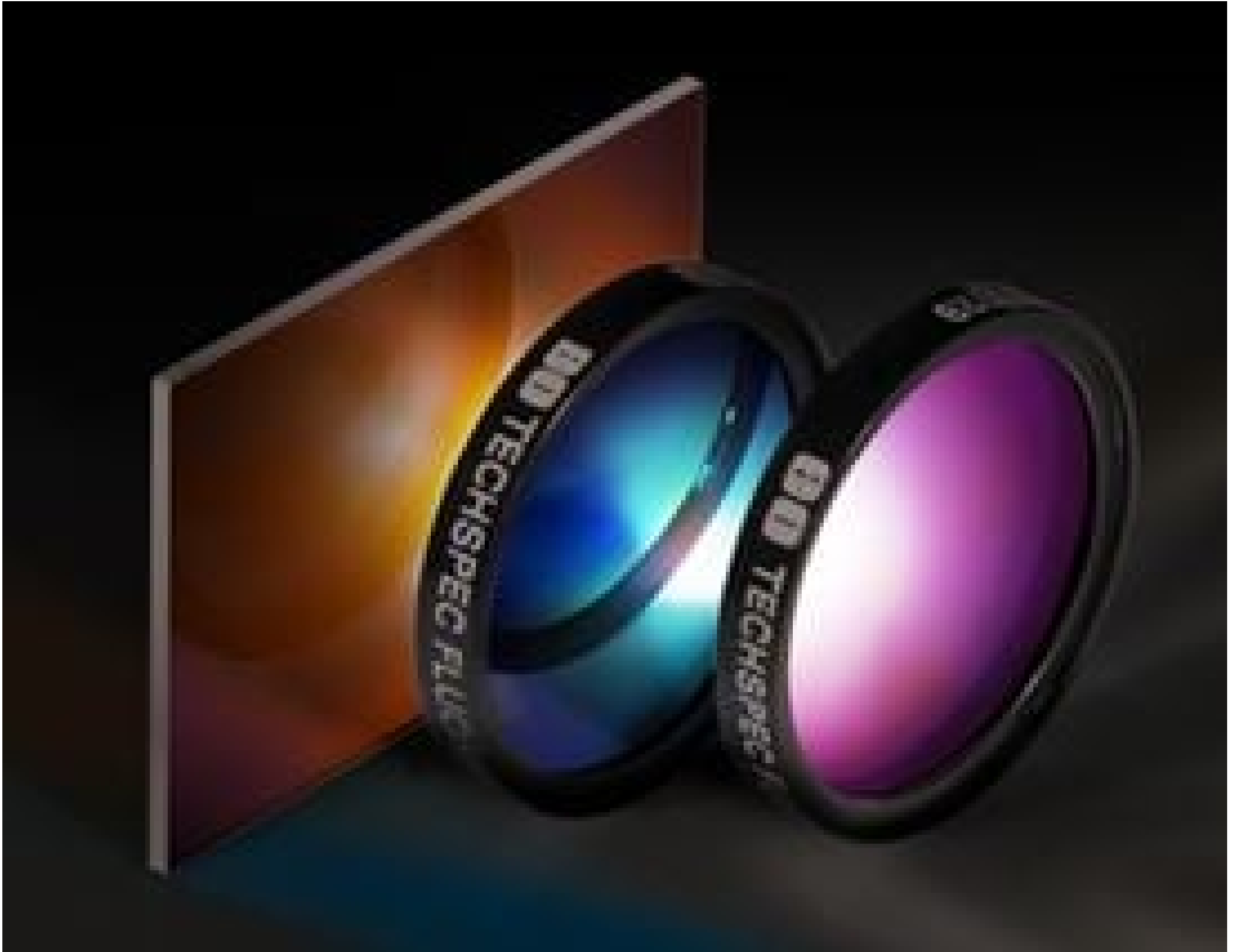
Fluorescence Filter Sets