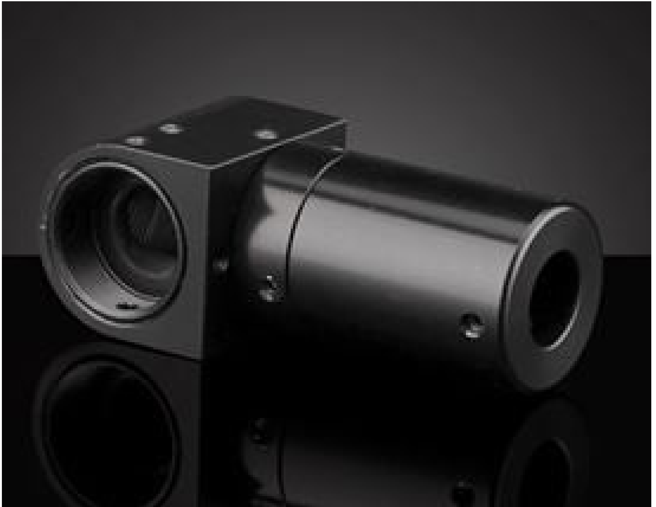
InfiniTube FM In-Line Attachment, +10X Objectives, #58-312

Mehr Produkte von Infinity Photo-Optical Company