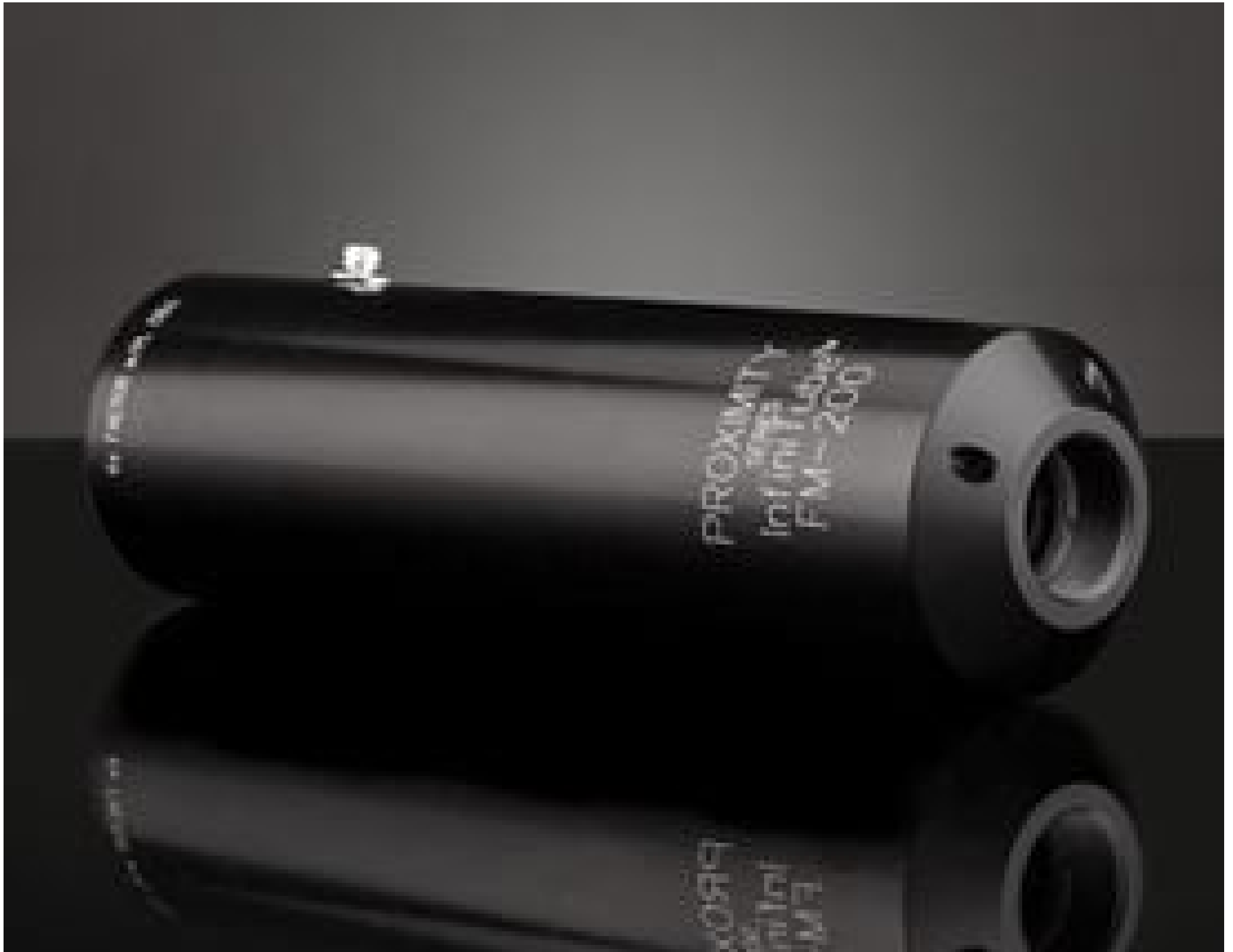
InfiniTube FM-200 (1X), #58-310

Mehr Produkte von Infinity Photo-Optical Company