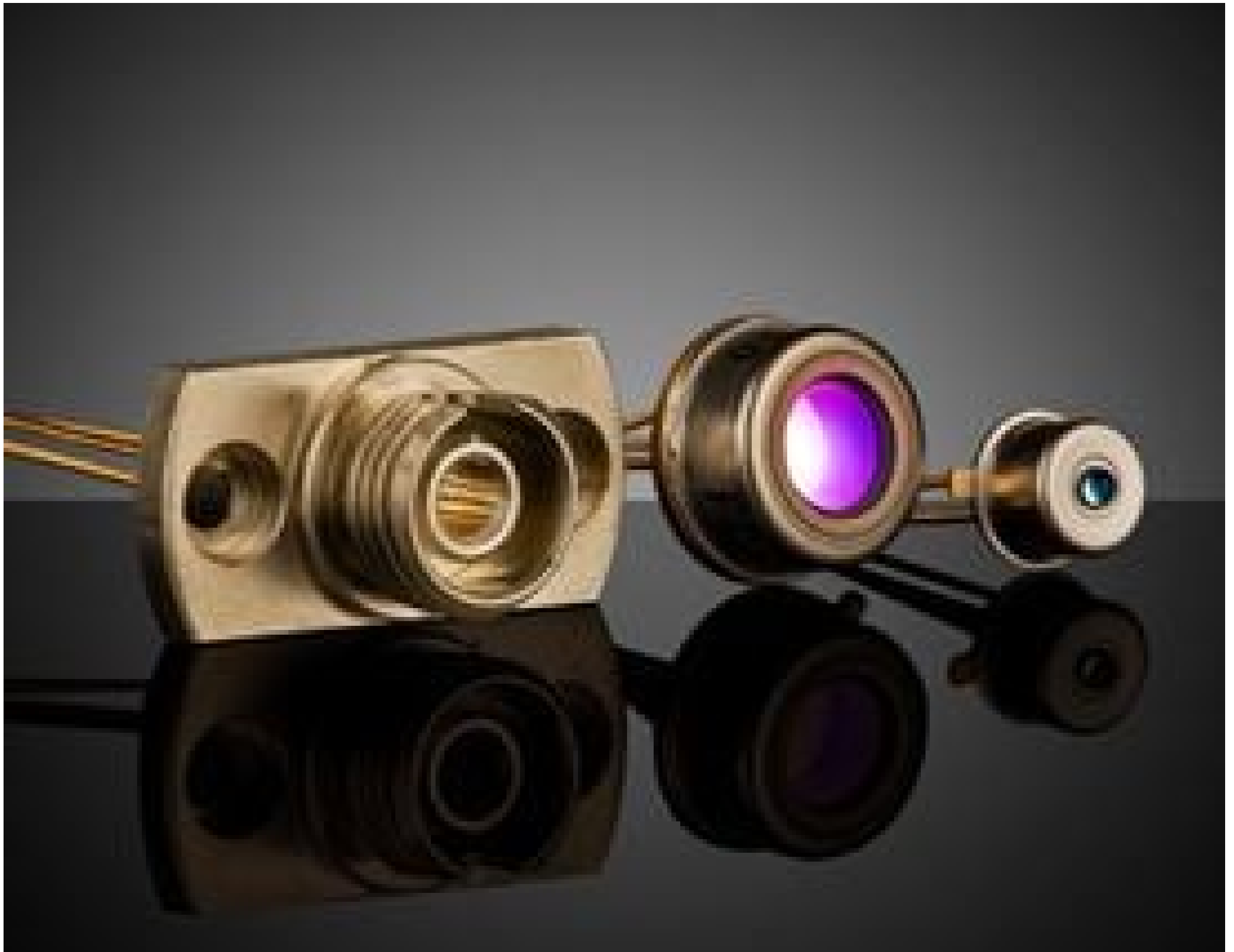
InGaAs Photodiodes (FC Receptacle , TO-5, TO-46)