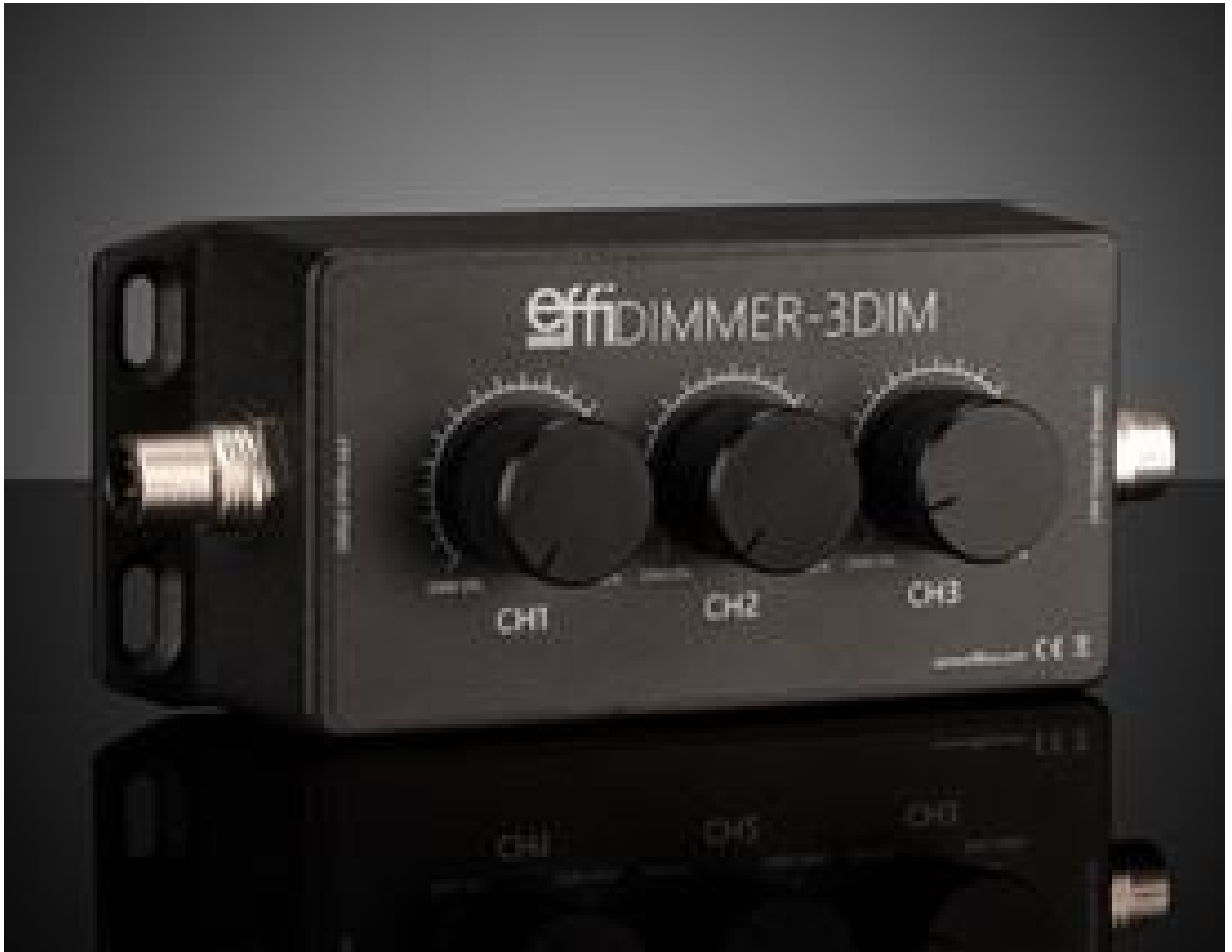
Intensity Adjustment Potentiometer for Effilux LED Lights