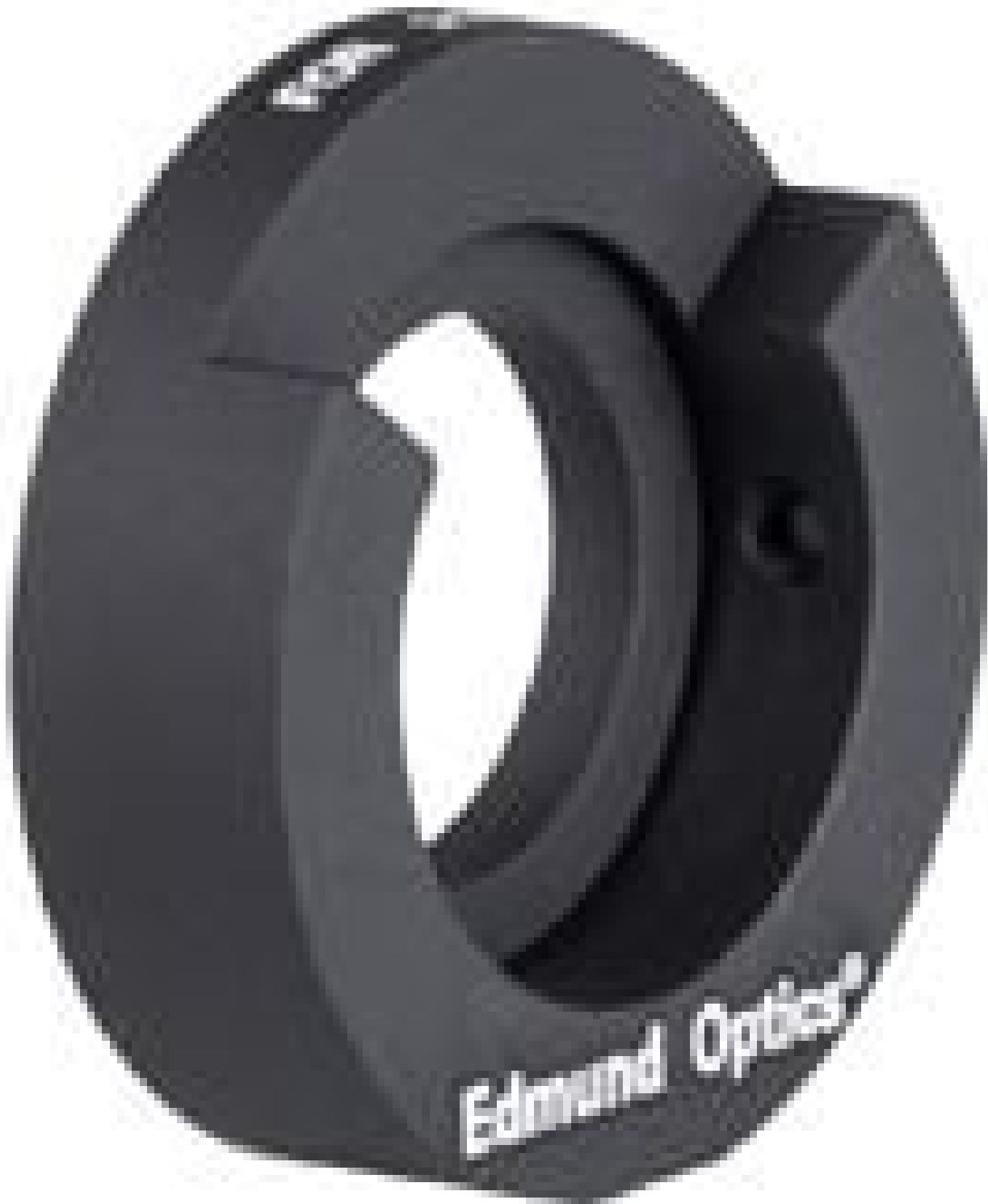
Iris Mount for 21mm Outer Diameter Irises, #54-862