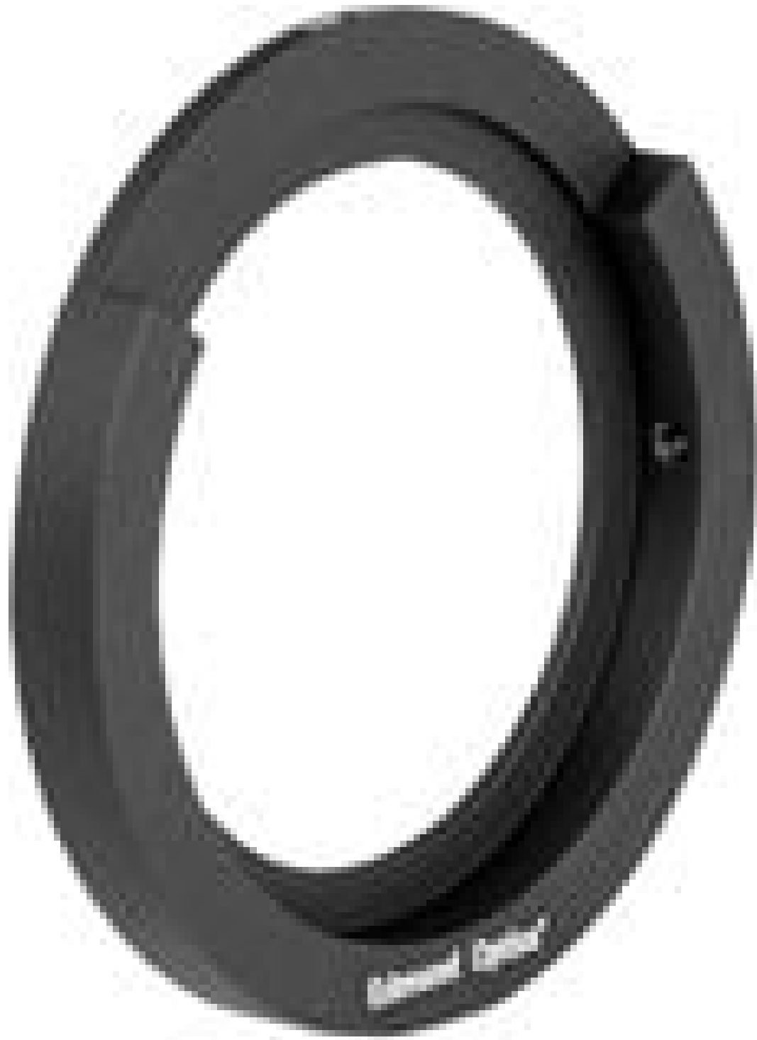
Iris Mount for 70mm Outer Diameter Irises, #53-921