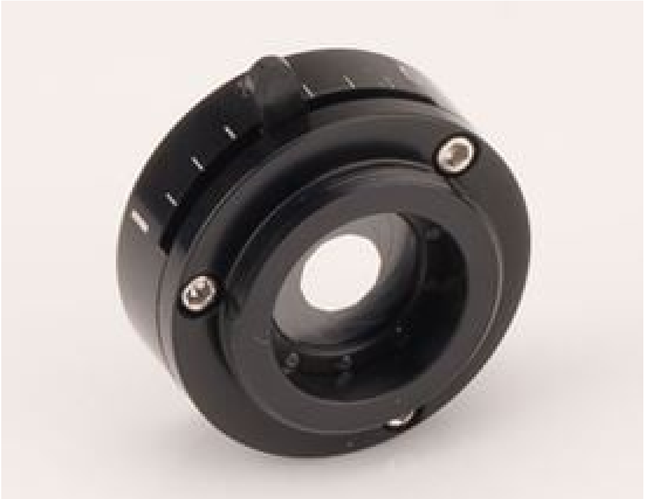
#53-789: KC Iris Diaphragm