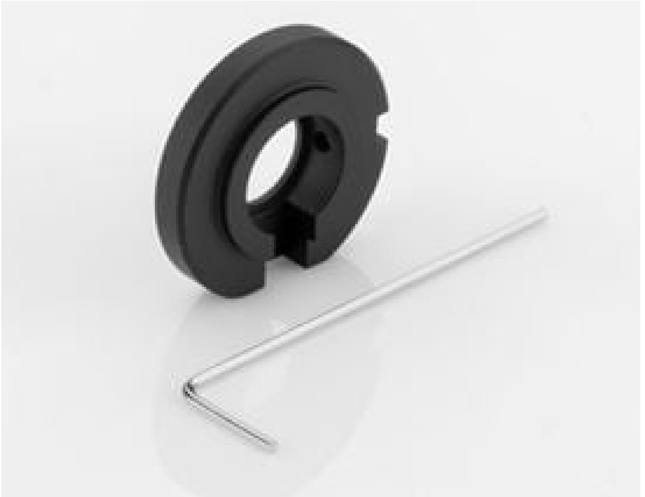
#33-645: Liquid Lens Holder for 16mm CxLens