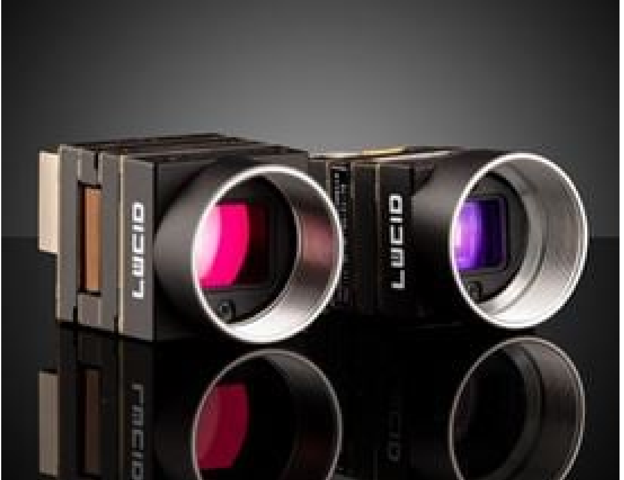
LUCID Vision Labs Phoenix™ Power over Ethernet (PoE) Cameras