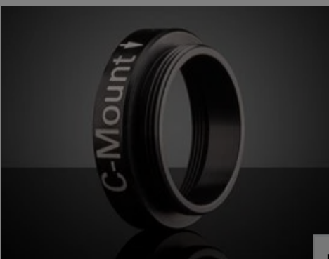
Male C-Mount to Female 1.035 x 40 TPI #88-955

Please select your shipping country to view the most accurate inventory information, and to determine the correct Edmund Optics sales office for your order.