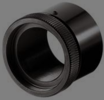
#03-625 - C-Mount Fokussiertubus mit feinem Gewinde, 30 mm - 50 mm Länge €118,00