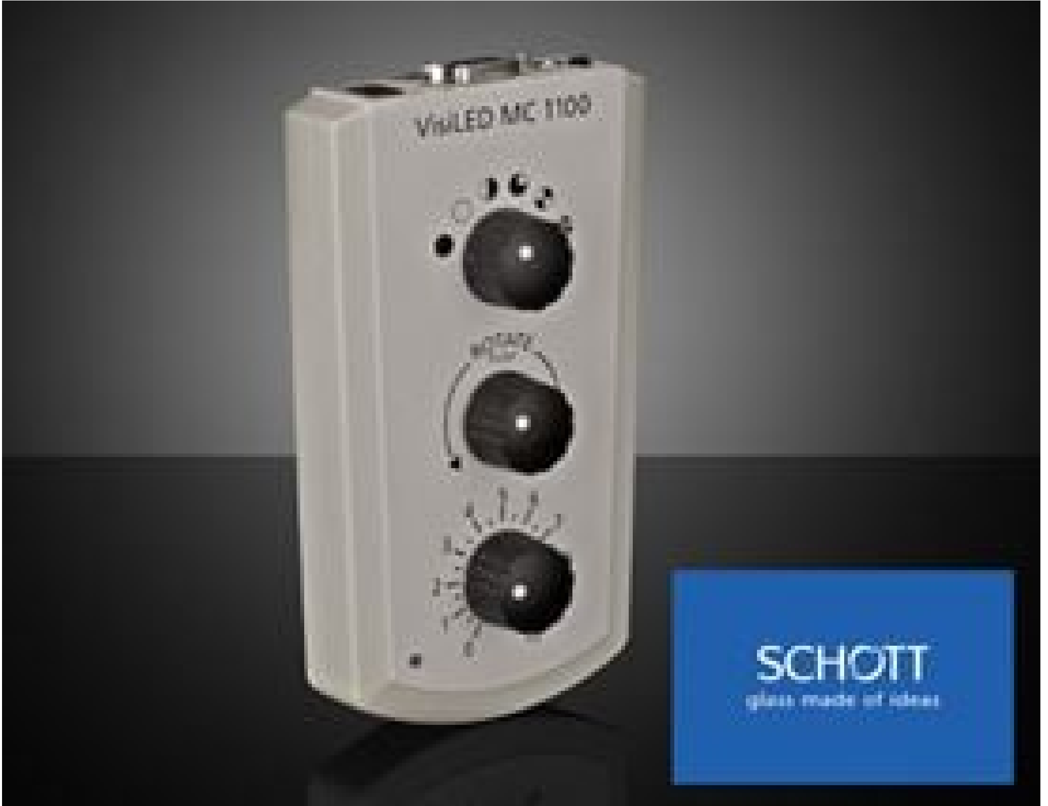
MC 1100, Multifunction Controller, #16-790

Mehr Produkte von SCHOTT Optical Components