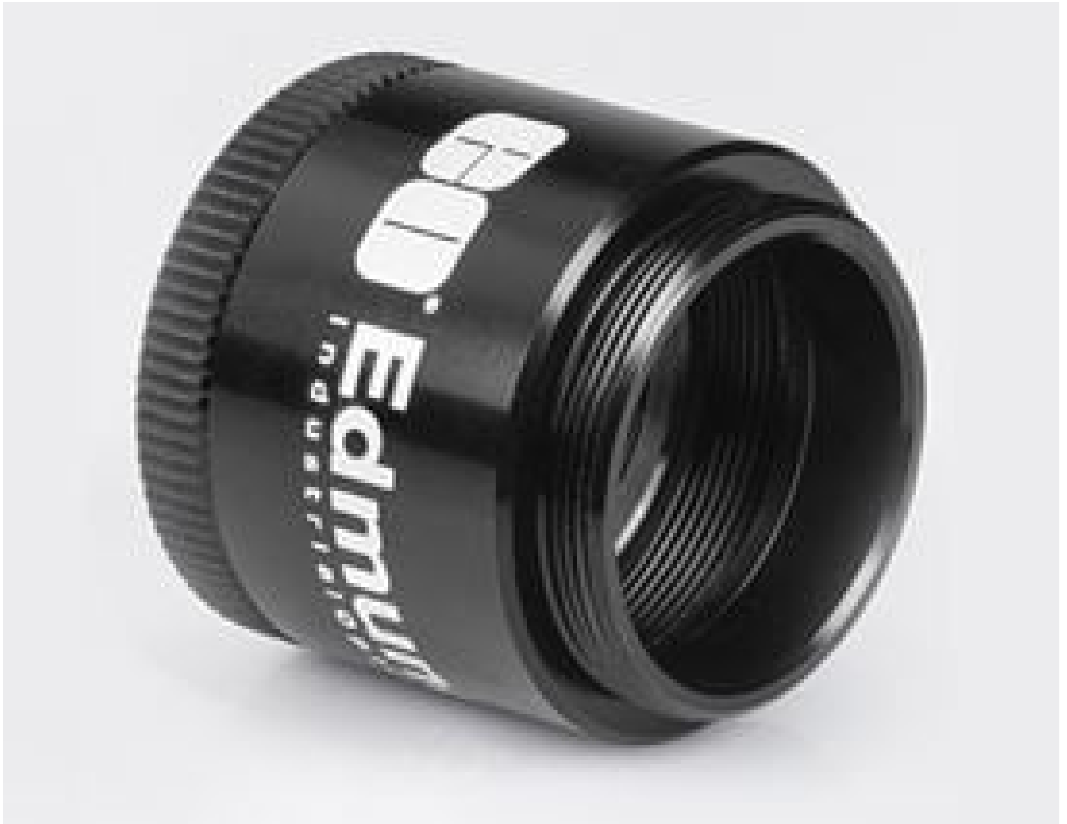
Mitutoyo Filter Holder, #56-993