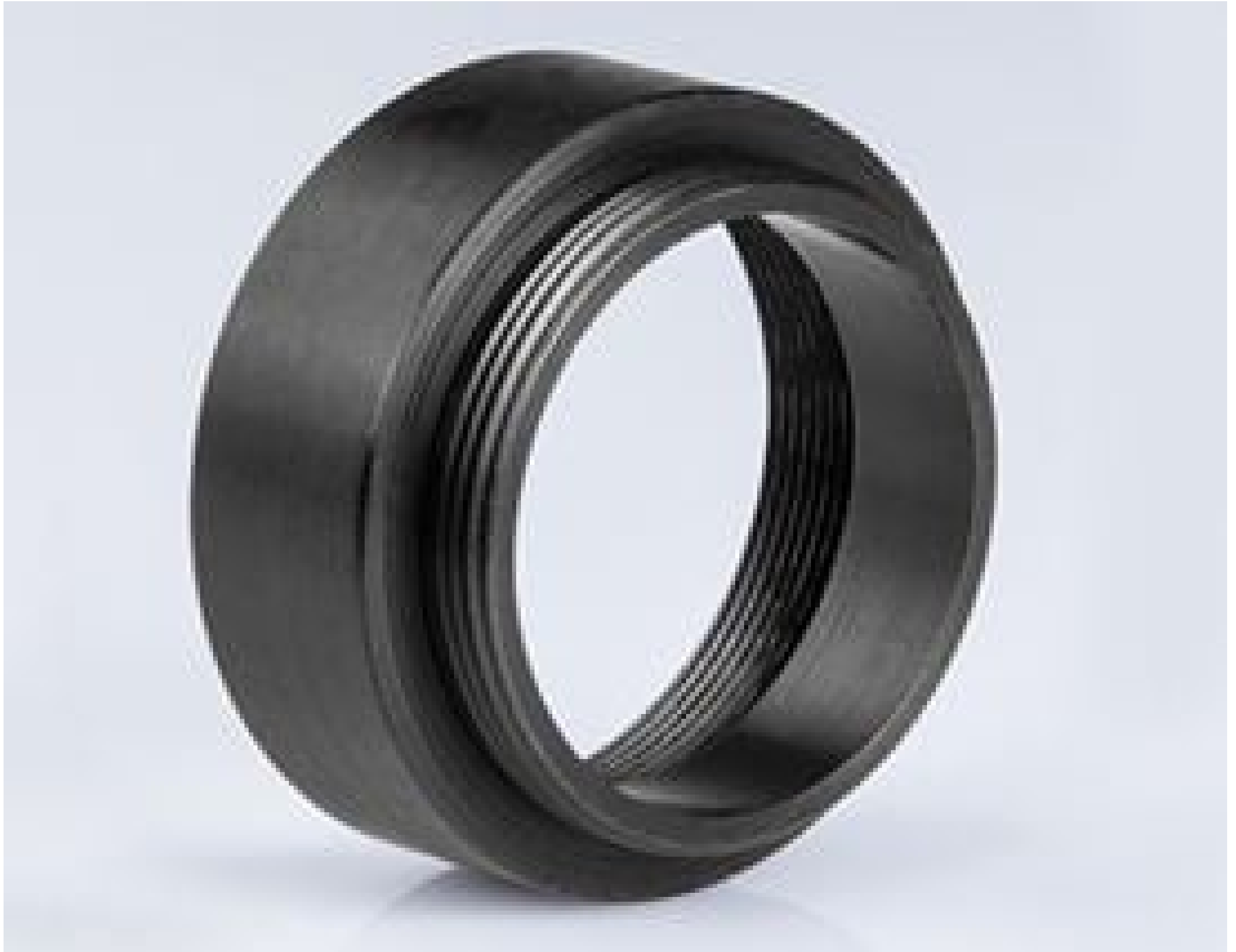
Mitutoyo to C-mount 10mm Adapter, #55-743