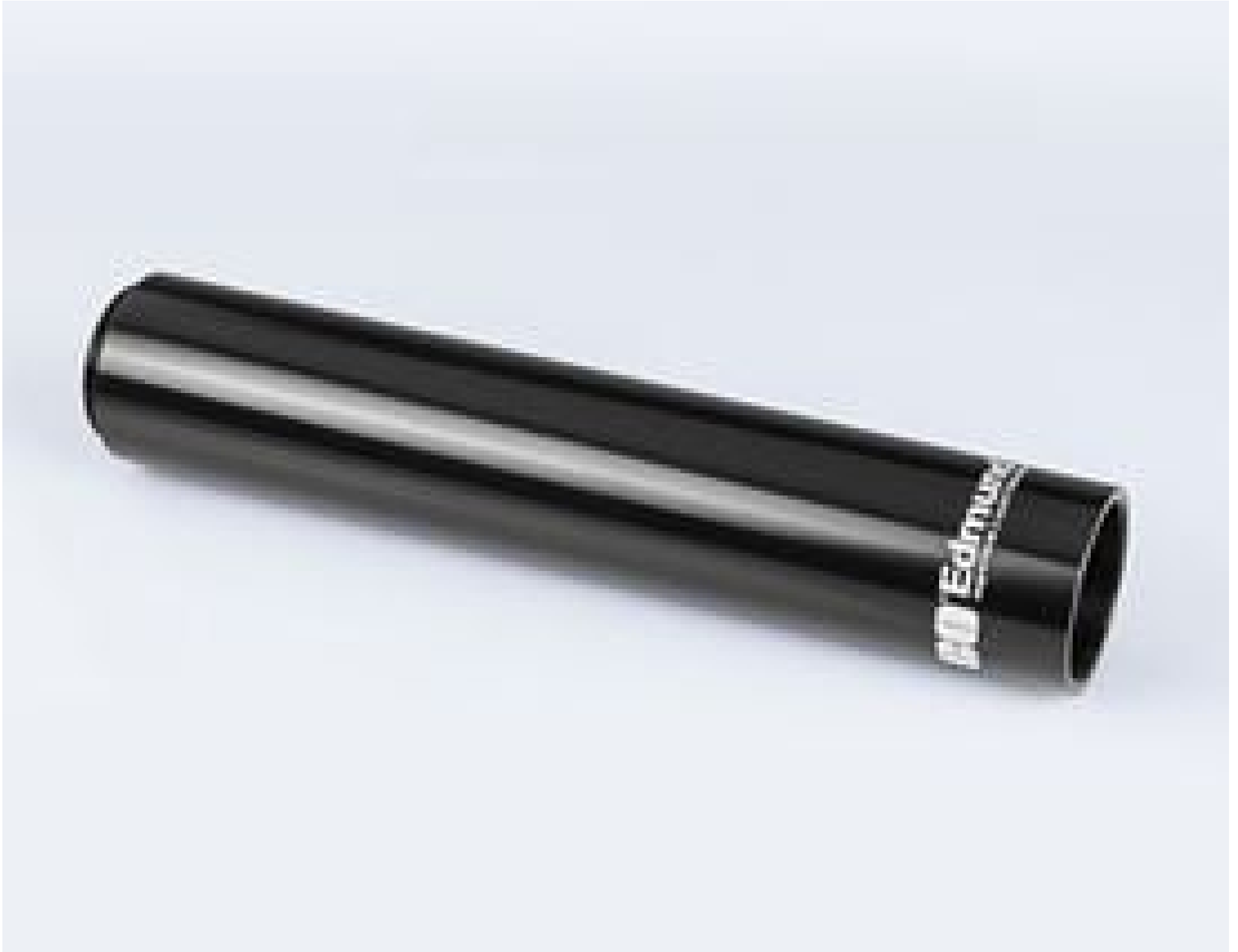
Mitutoyo to C-mount Camera 152.5mm Extension Tube, #56-992