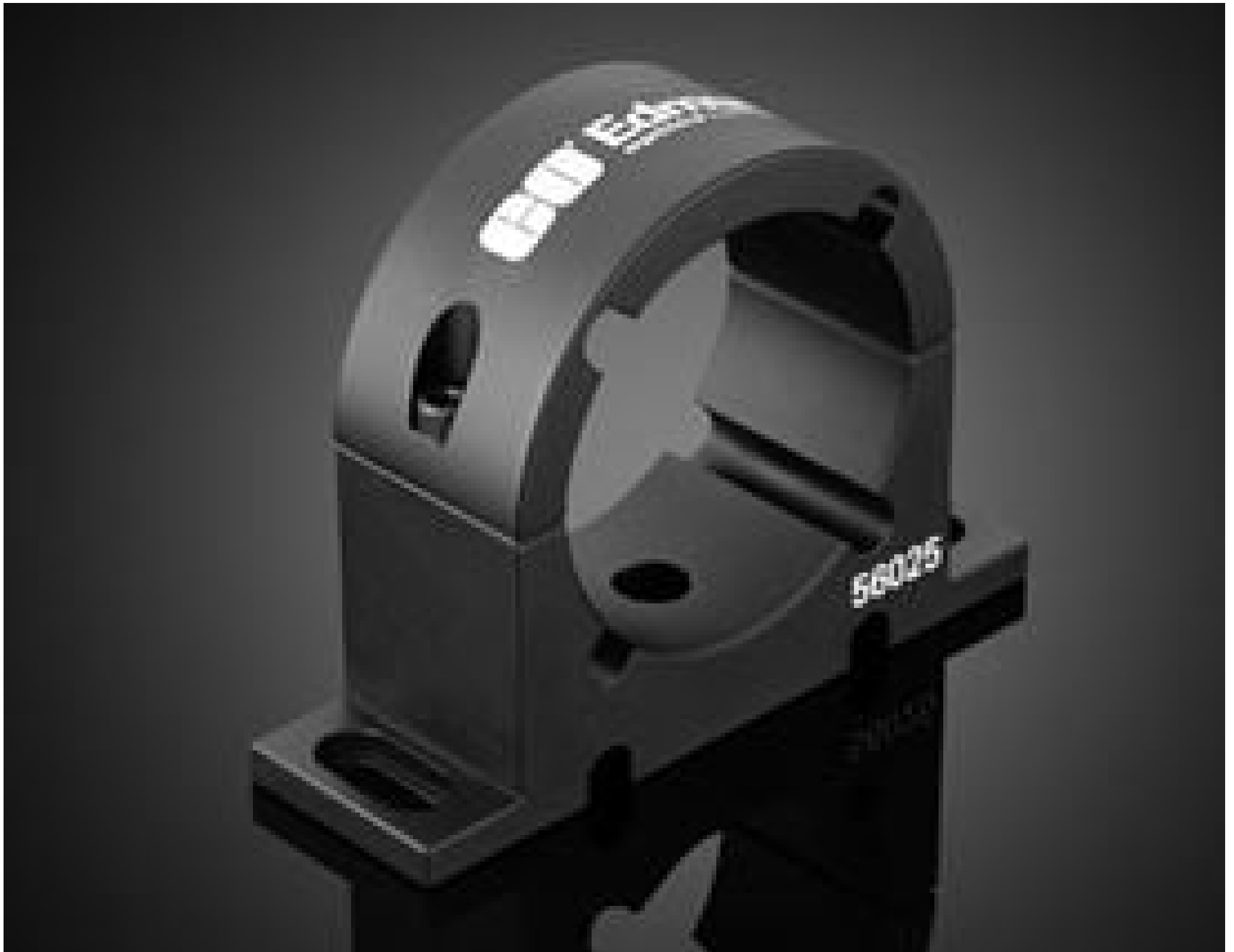
#56-025: Mounting Clamp, 65mm Inner Diameter