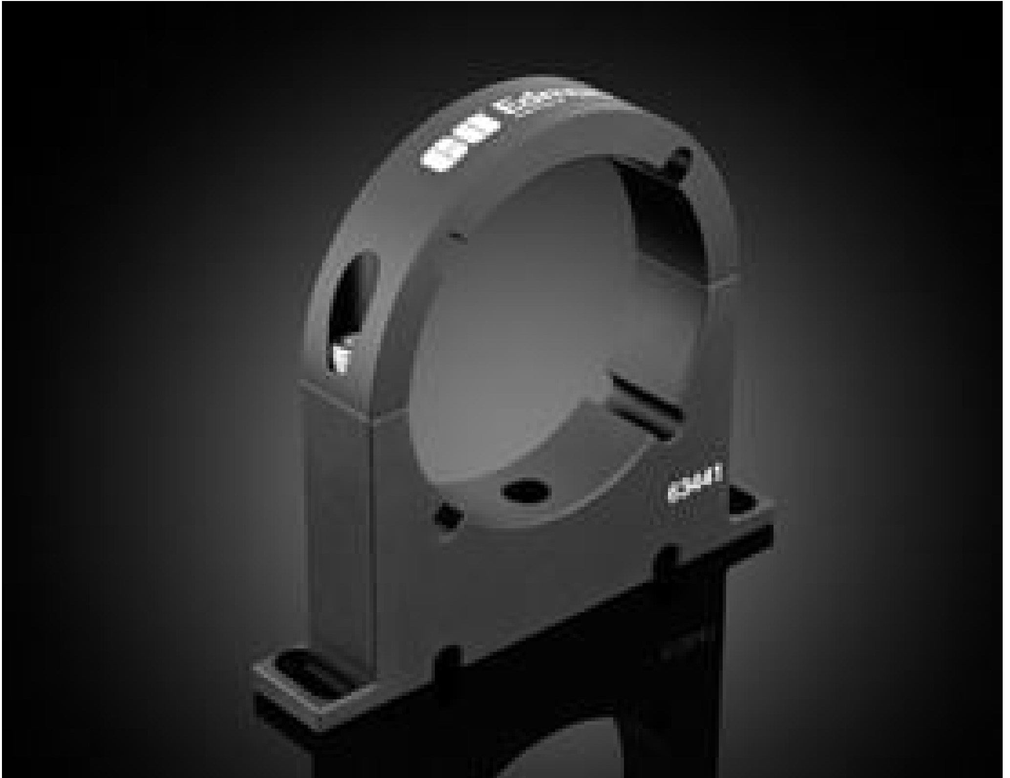
#63-441: Mounting Clamp, 90mm Inner Diameter