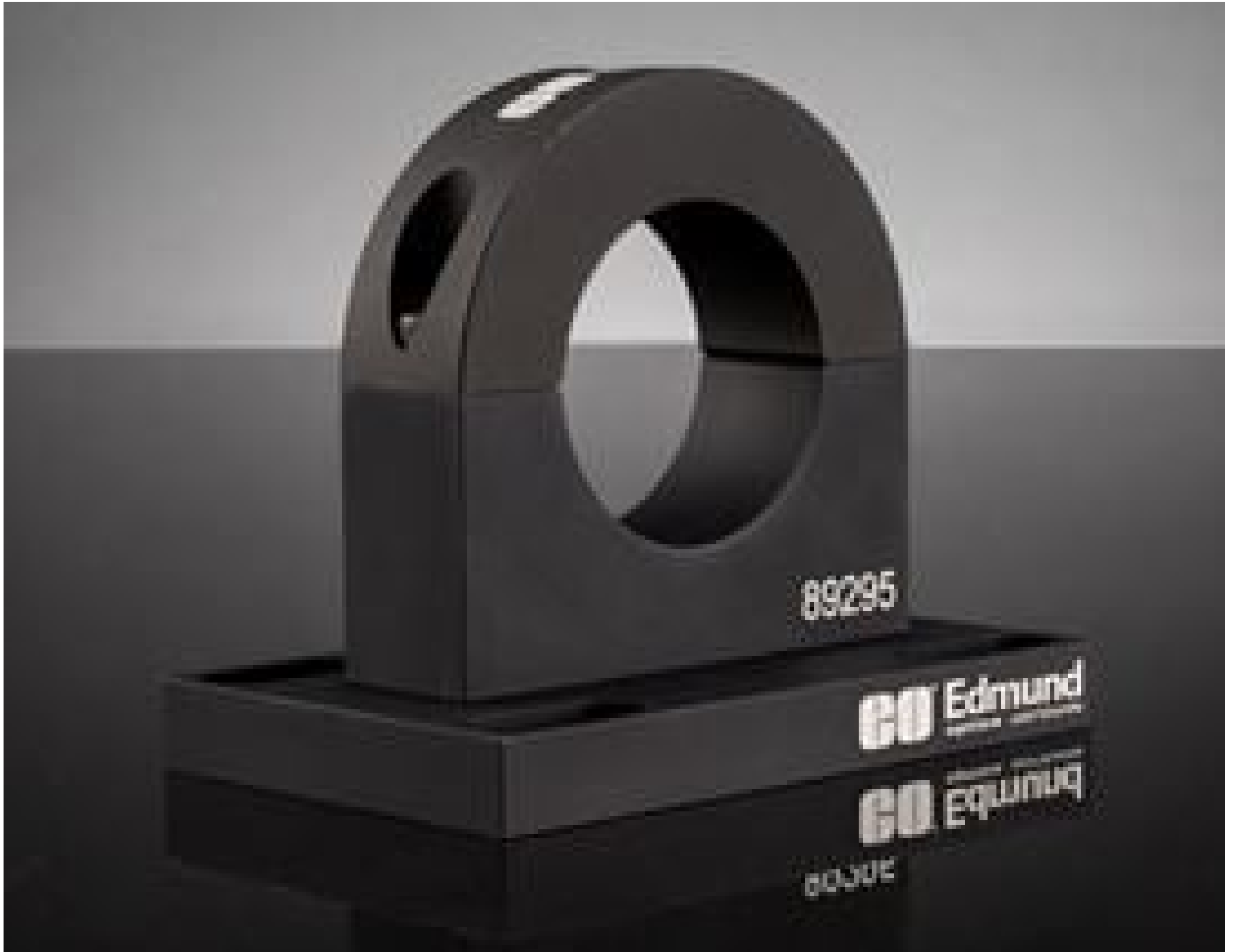
Mounting Clamp for 2 - 8X Research-Grade Variable Beam Expander, #89-295