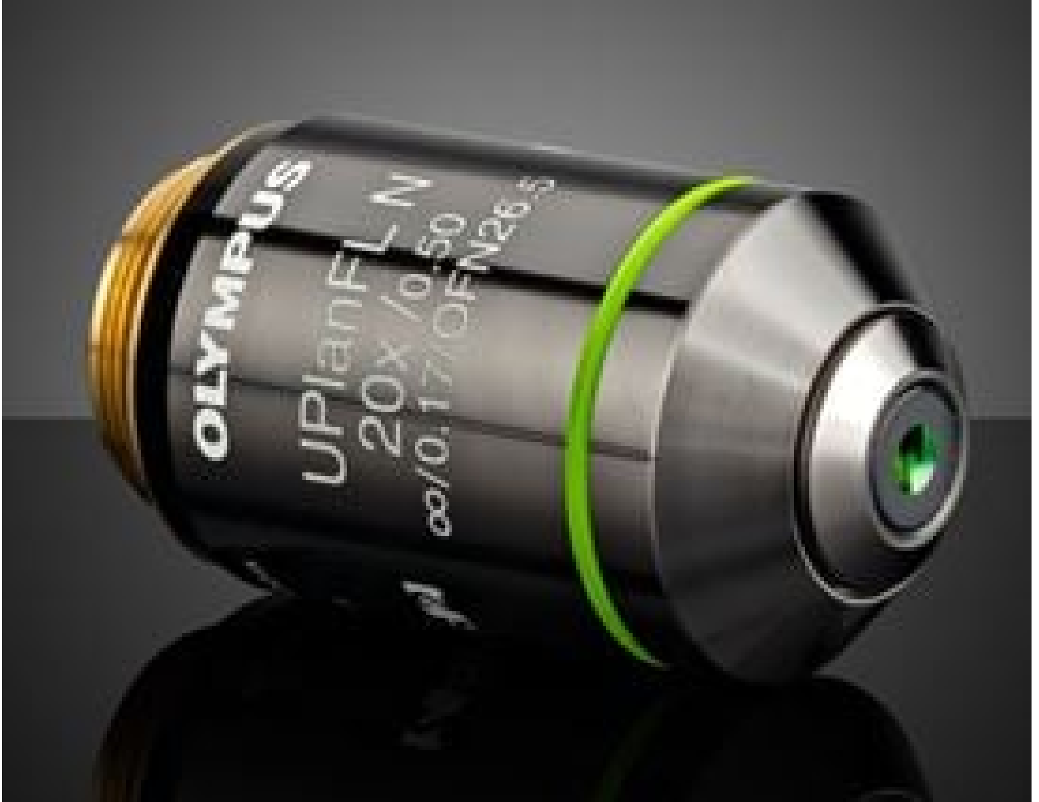
Olympus UPLFLN 20X Objective