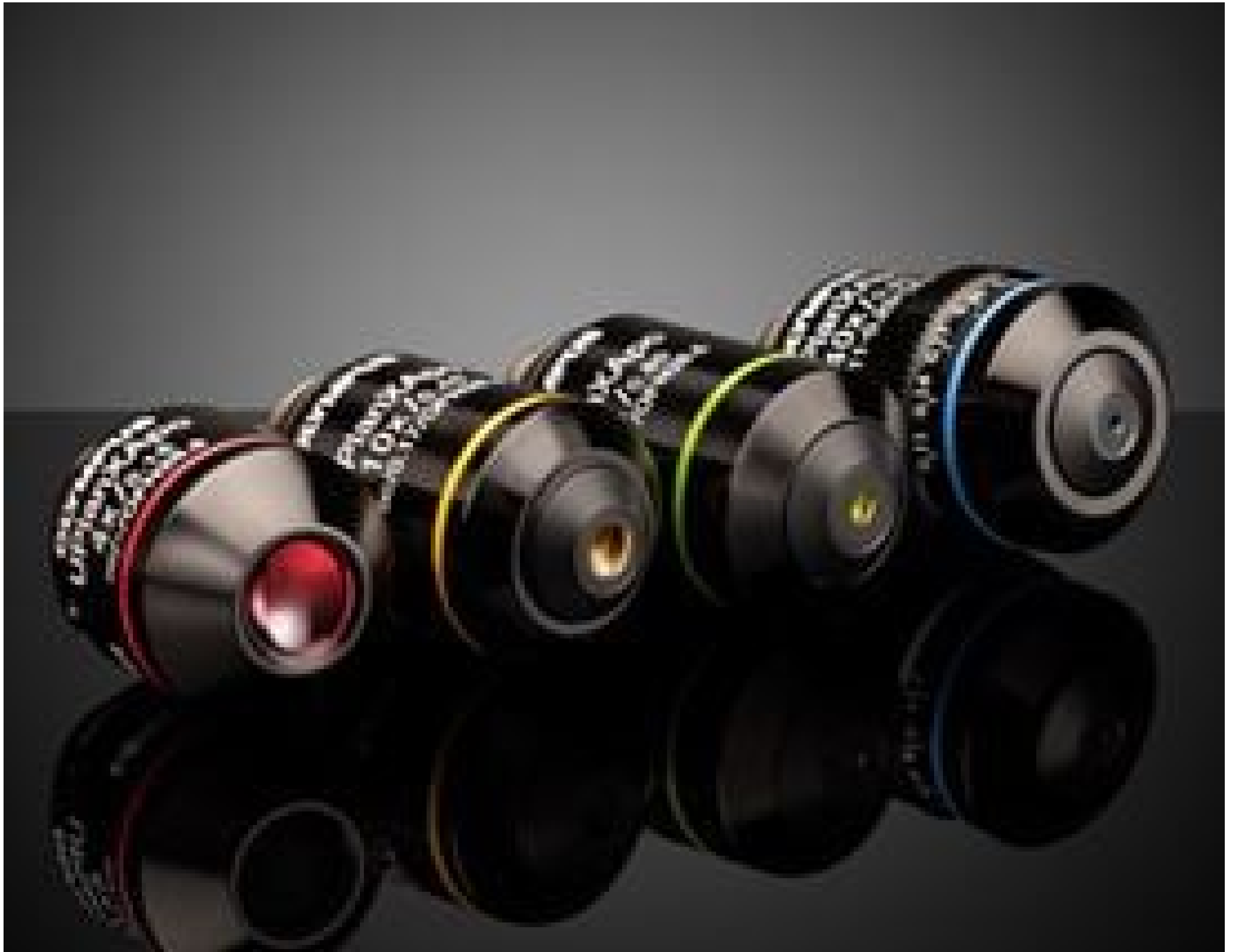
Olympus X-Line Extended Apochromat Objectives