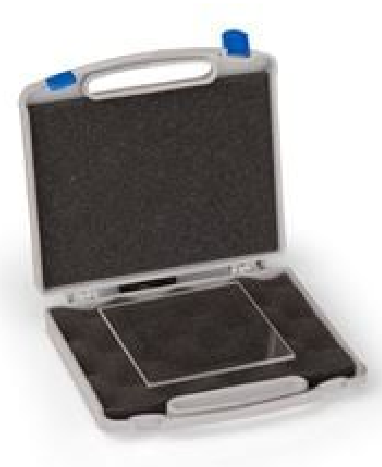
Particle Standard Target