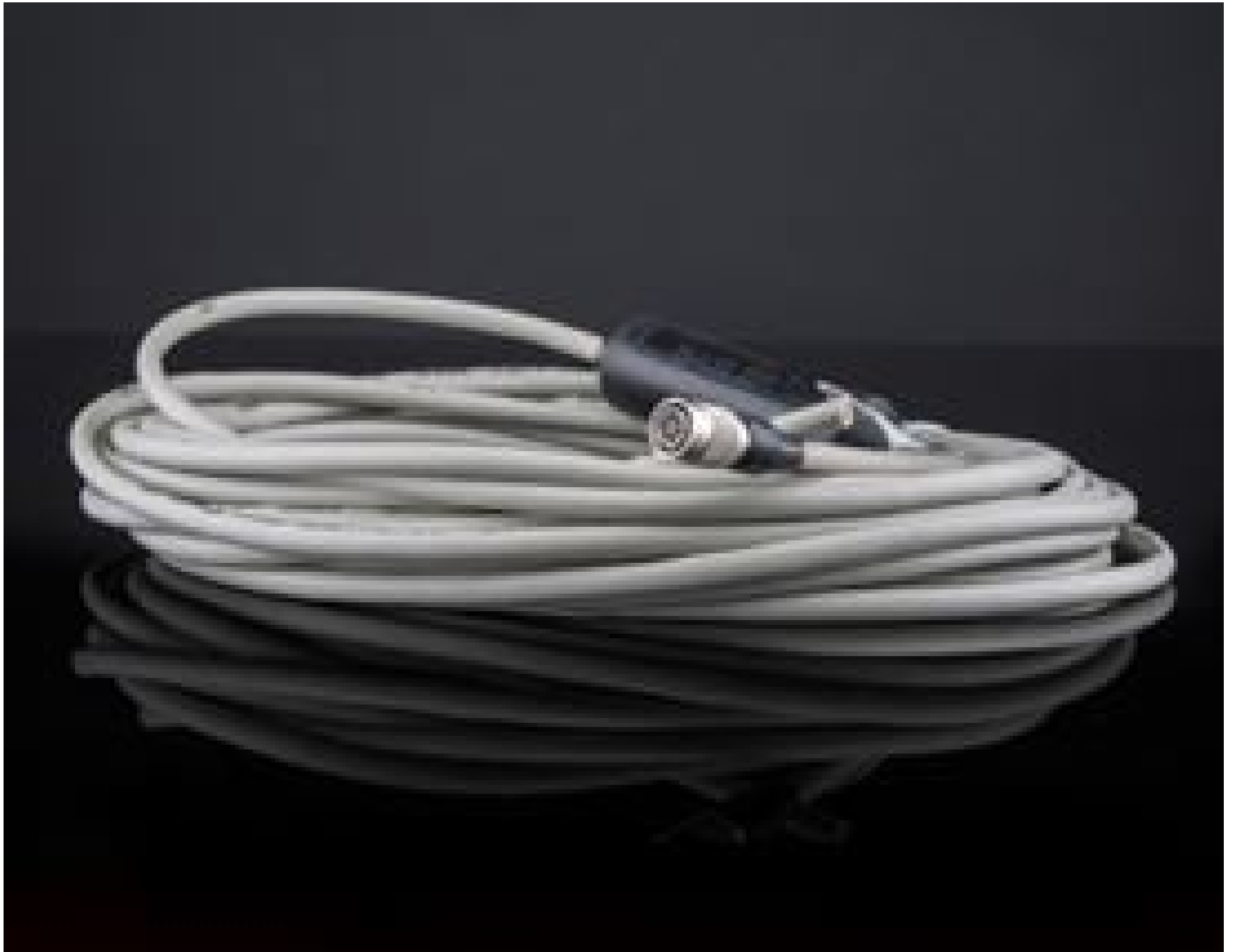
PLC (Programmable Logic Controller) I/O Cable Hirose 6 Pin 10m, #68-467