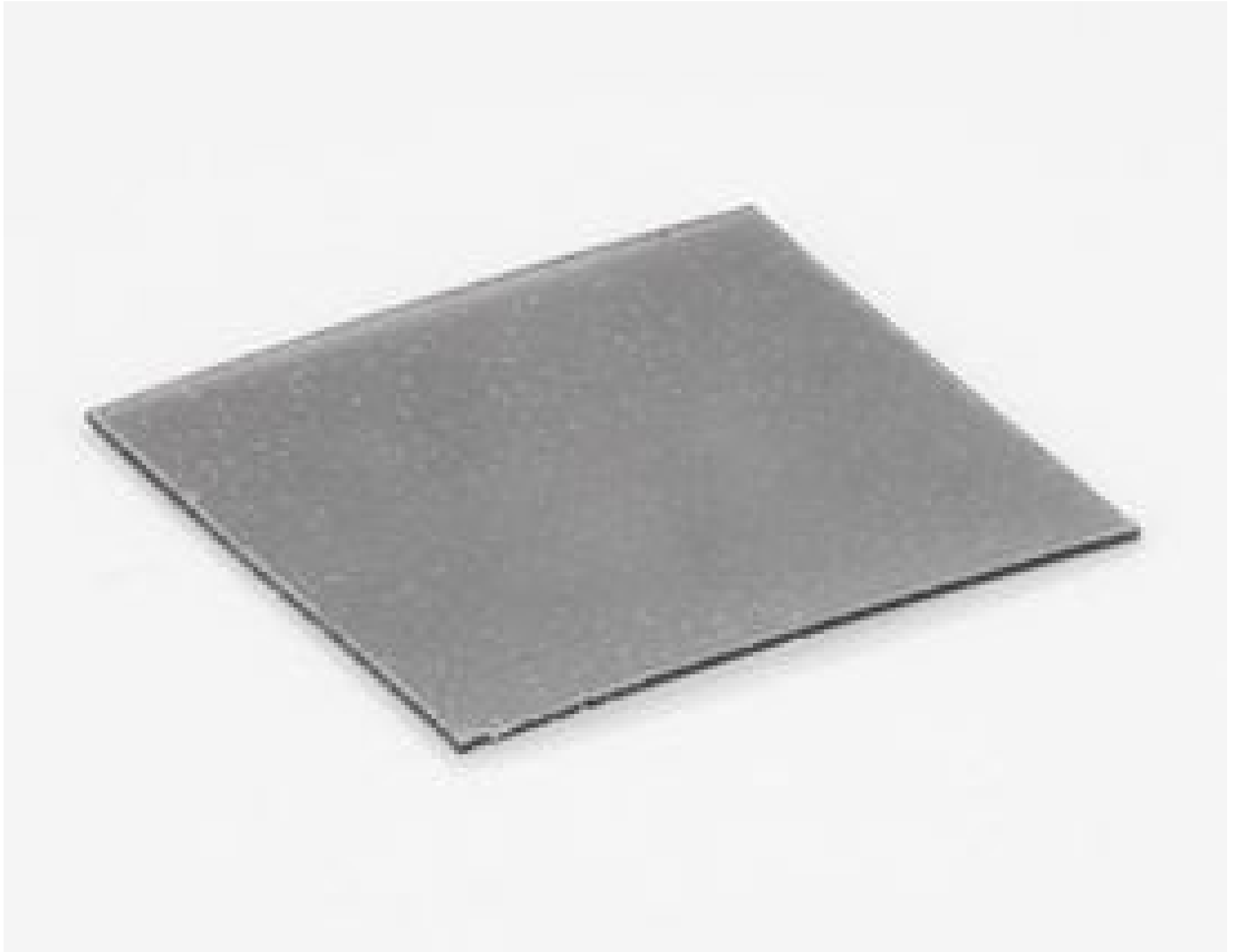
#34-881: Polarizer Accessory for 1 LED Bar Light