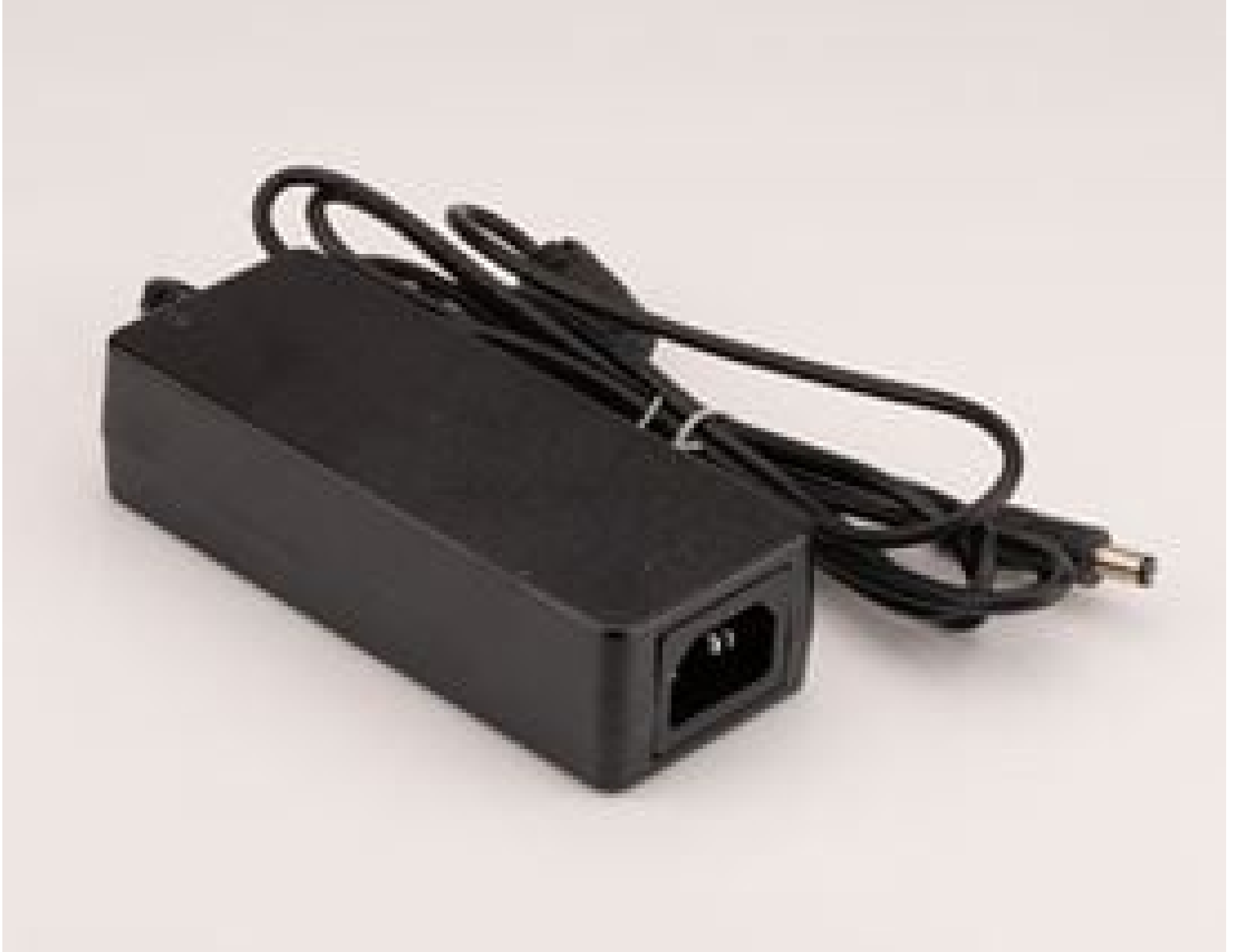
#16-791: Power Supply for SCHOTT VisiLED Ringlights

Mehr Produkte von SCHOTT Optical Components