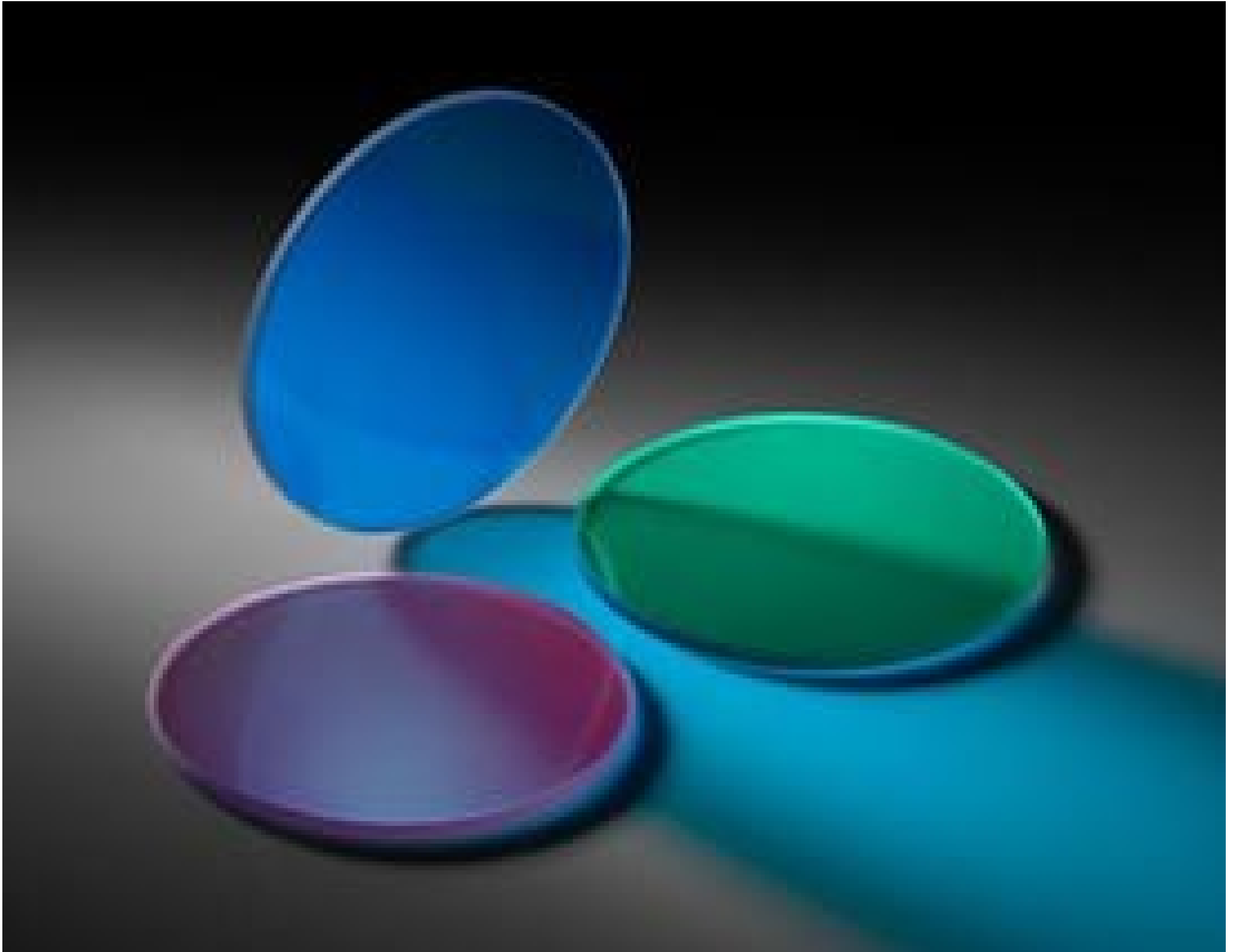
Red, Green, and Blue Dichroic Filter Set