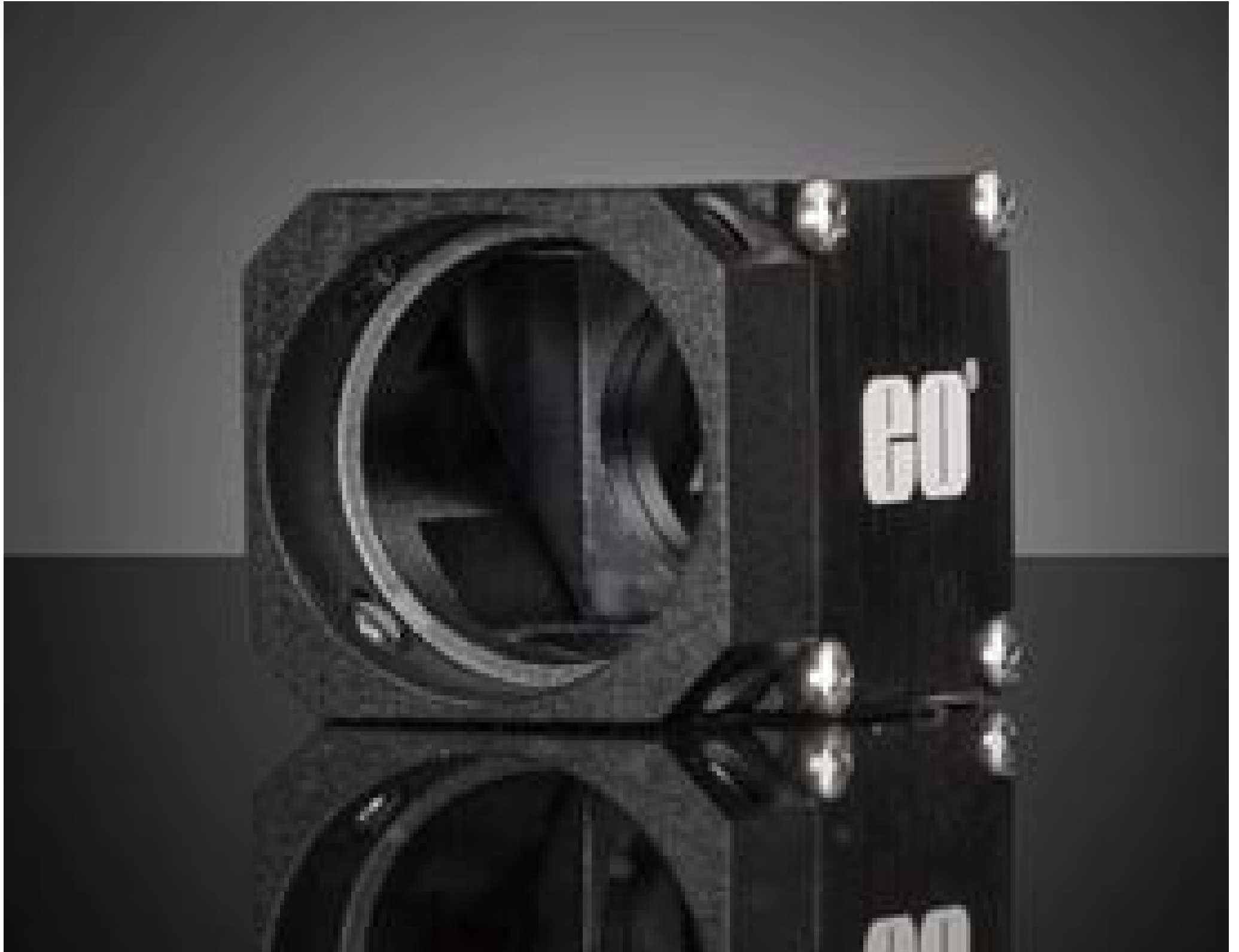
Right Angle Adapter For 18mm Dia. Lenses, #88-215