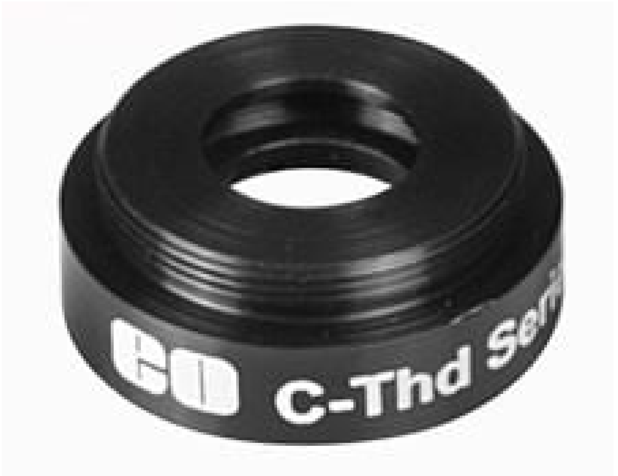
C-Mount to TO-8 Detector Mount, #58-733