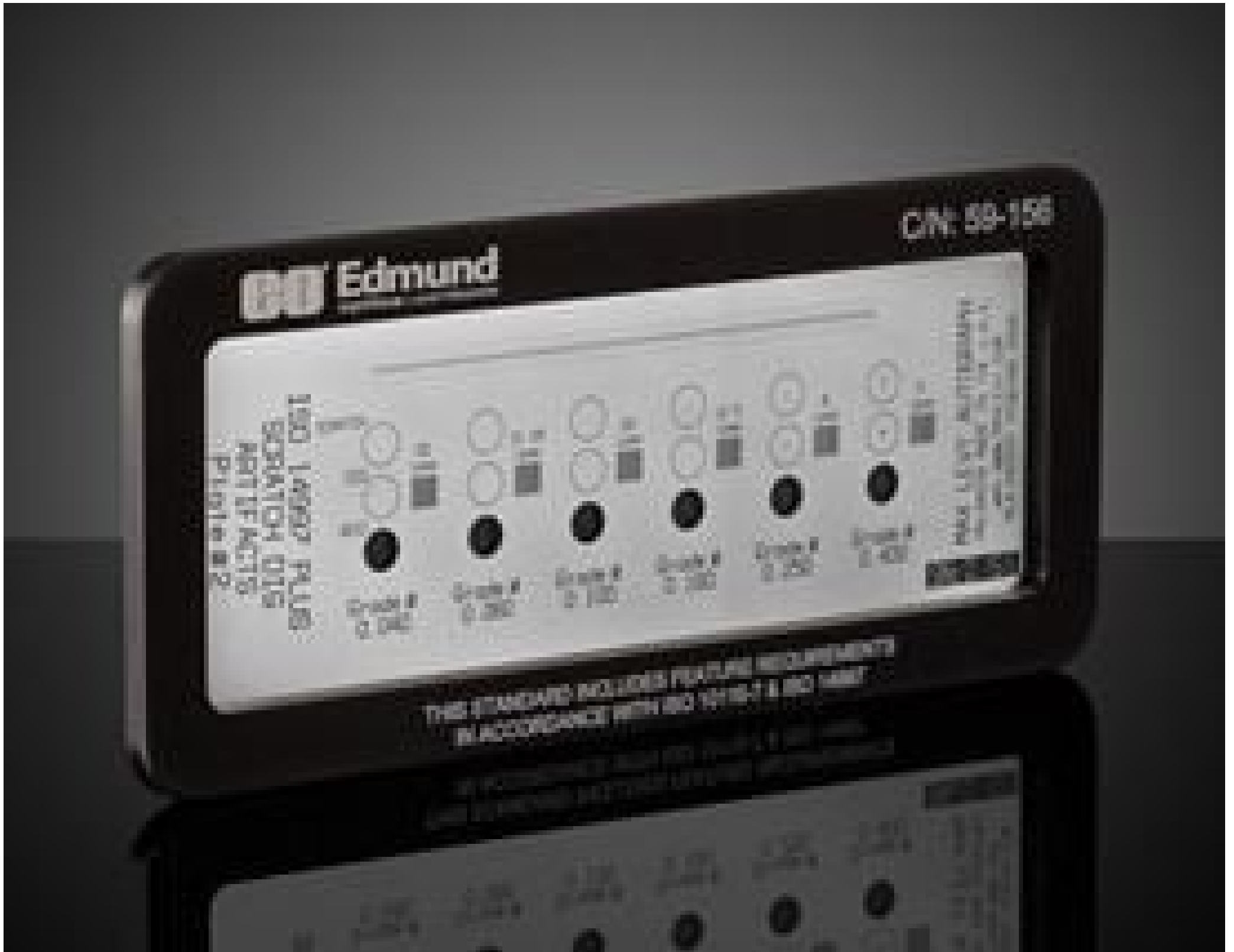
Scratch & Dig Target (1st Surface Negative), #59-156