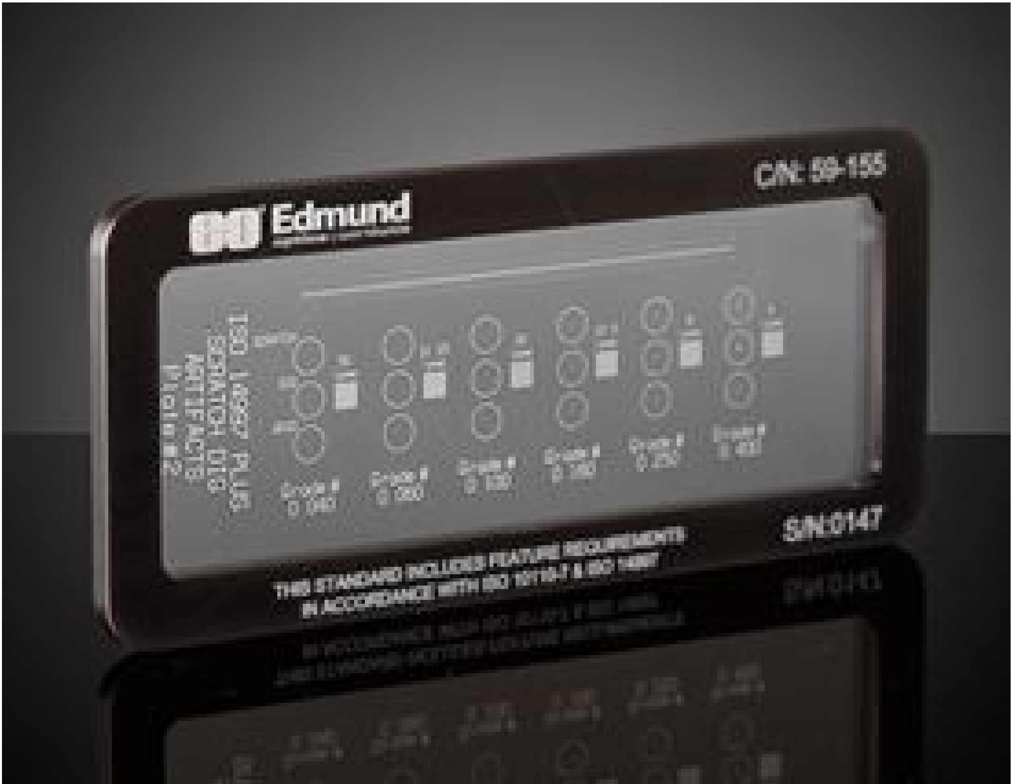
Scratch & Dig Target (2nd Surface Positive), #59-155