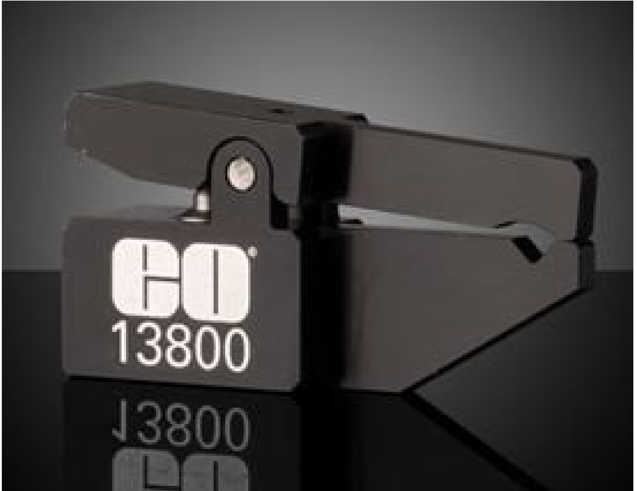
Small Lens Clamp for 4-8mm Dia. Optics. #13-800