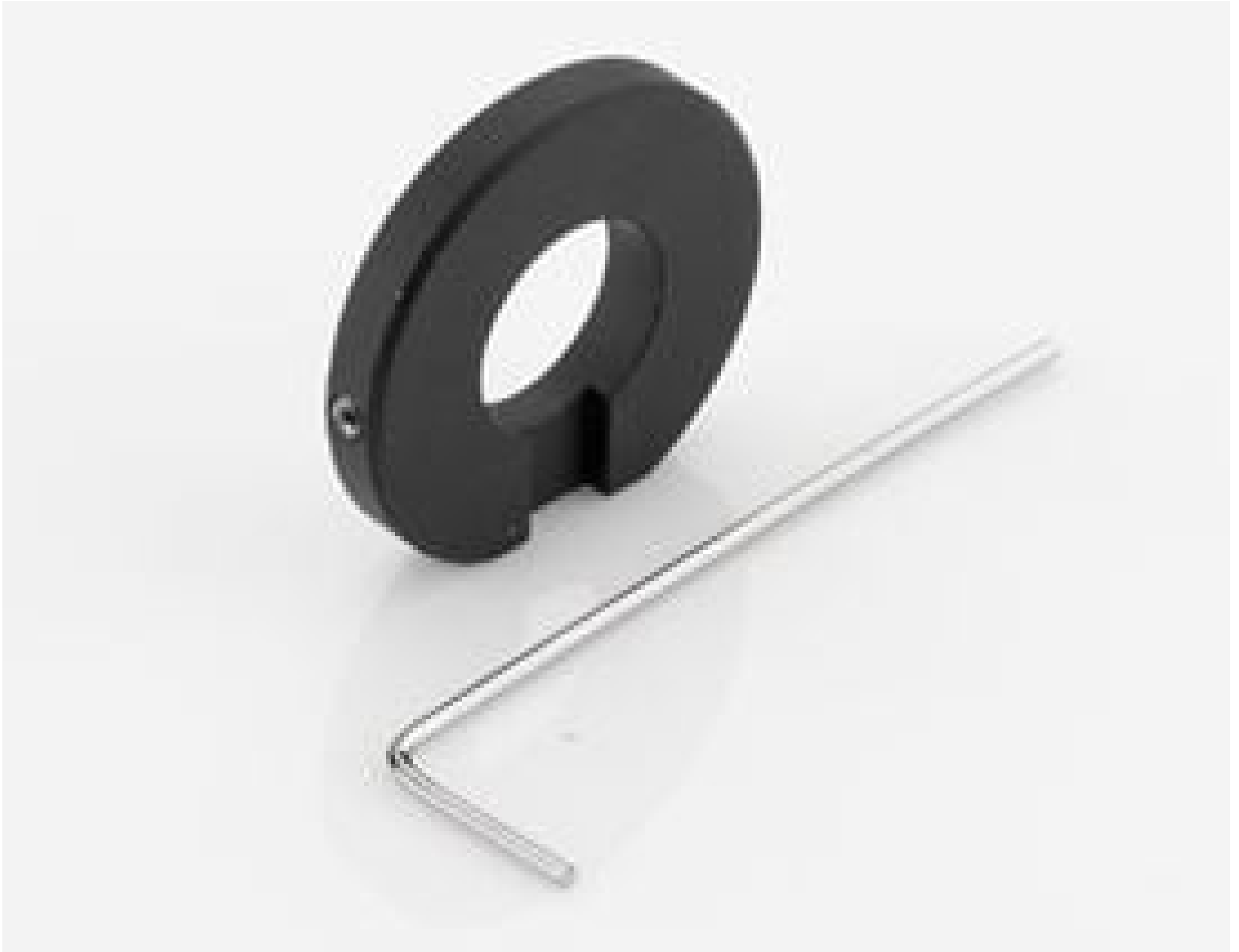
#33-675: Small Liquid Lens Holder for 35mm Cx Lens