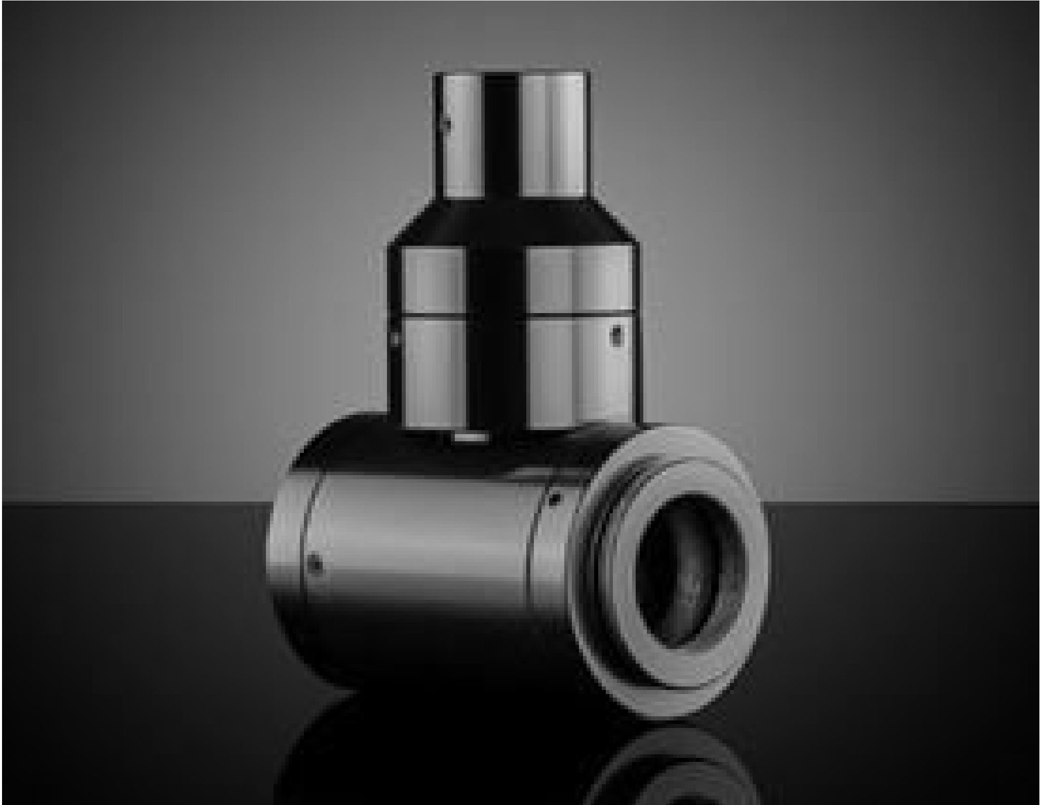
Standard In-Line Attachment (Optimized at 2X-10X), InfiTube

Mehr Produkte von Infinity Photo-Optical Company