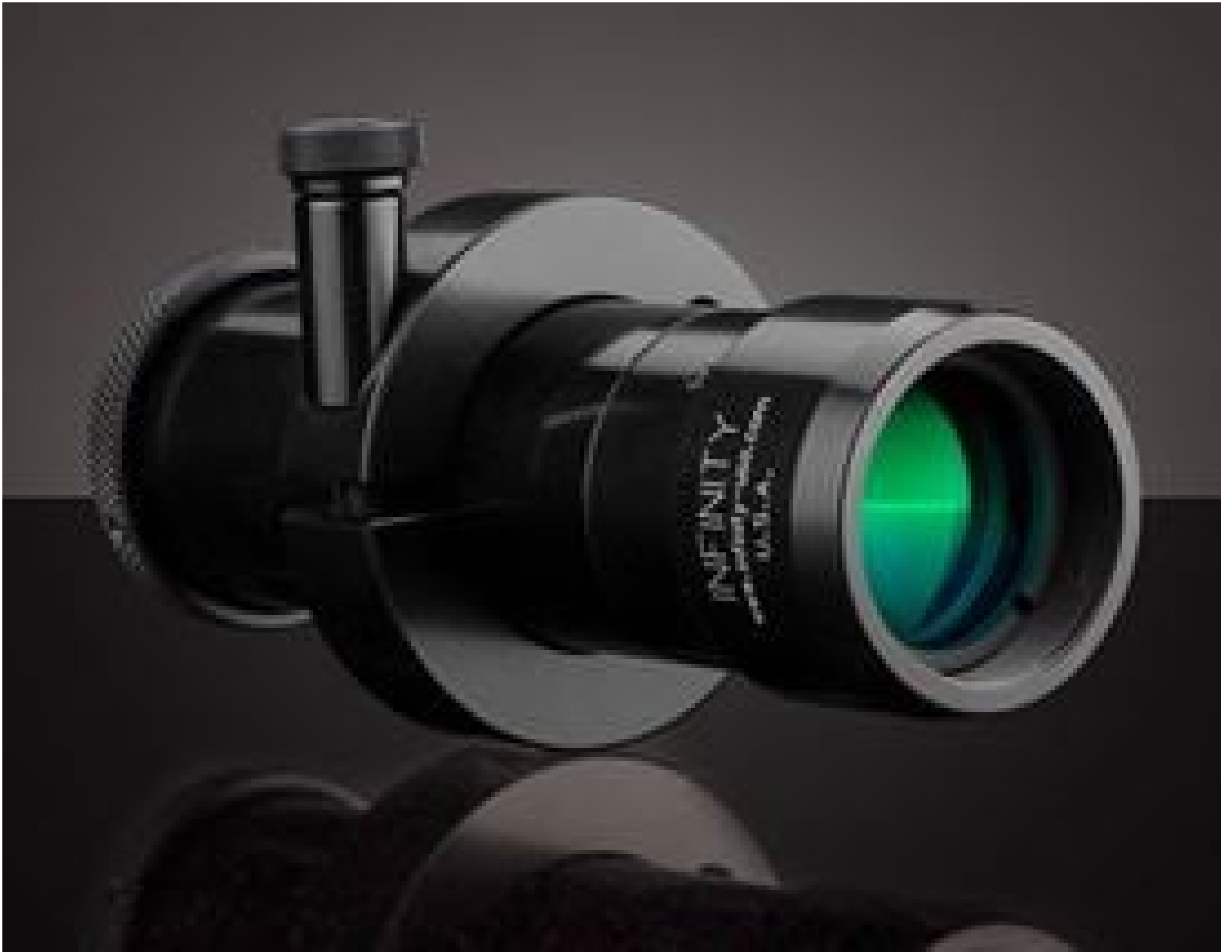
Standard (with no In-Line Attachment), InfiniTube, #56-125

Mehr Produkte von Infinity Photo-Optical Company