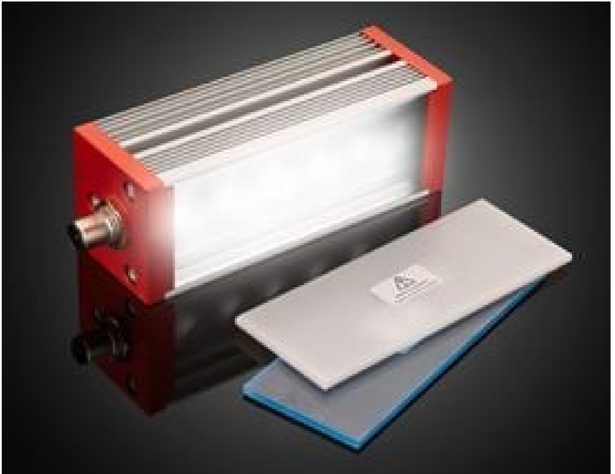
Effilux SWIR LED Bar Lights