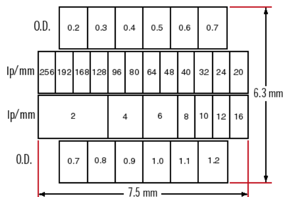
Transmitted Microslide #55-641