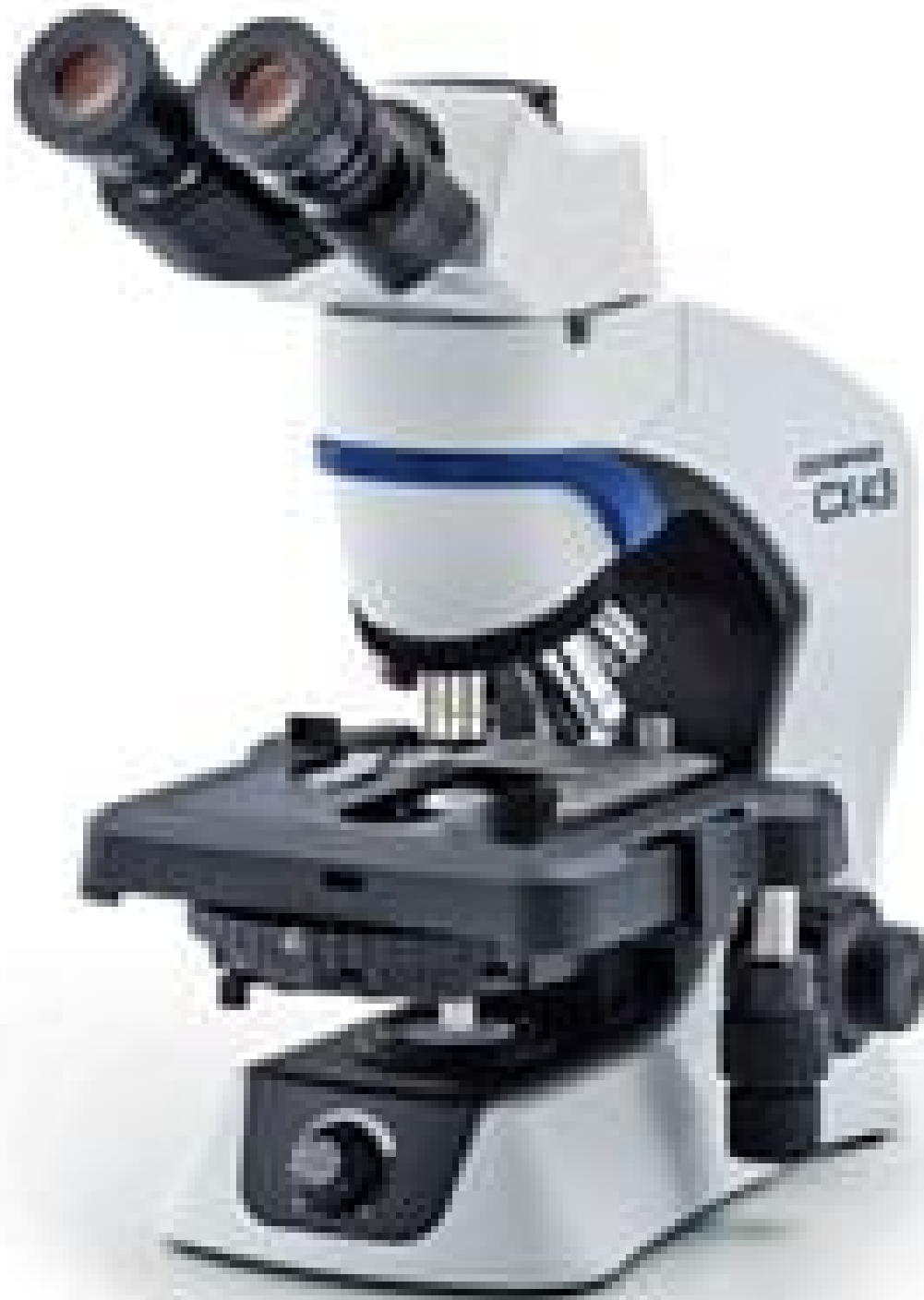
Image shown is full assembly. Each component sold separately. See Technical Information tab for additional details.