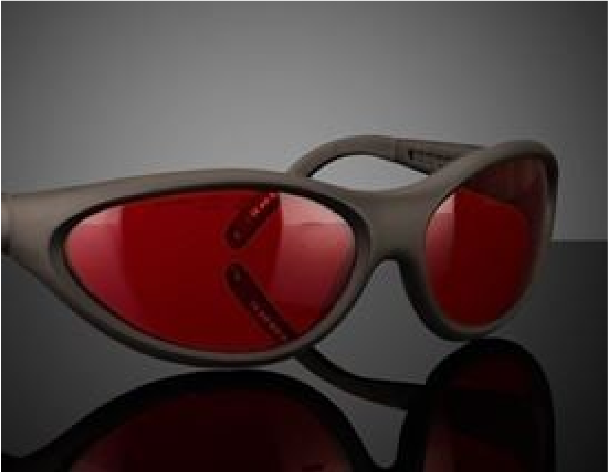
Image represents frame style only. Filter color will vary by product specification.